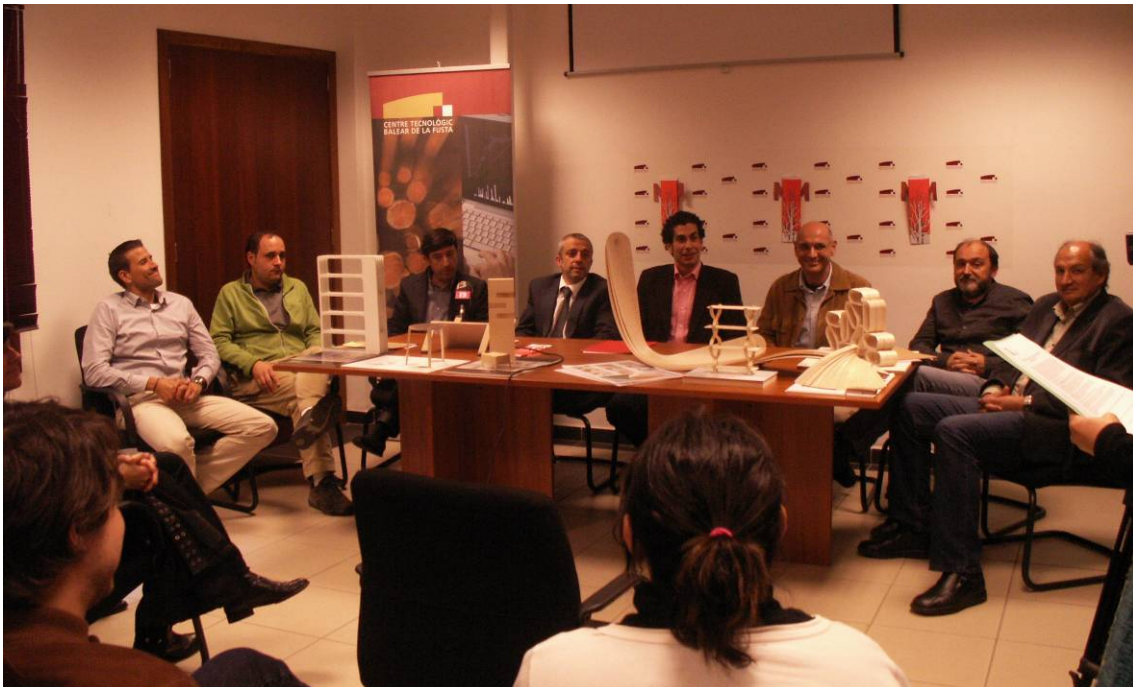
IMAGEN DE LA RUEDA DE PRENSA DE COMUNICACIÓN VEREDICTO JURADO